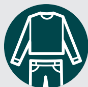
Vêtements amples et couvrants