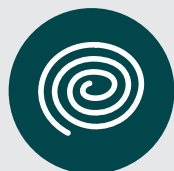
Serpentins à l'extérieur